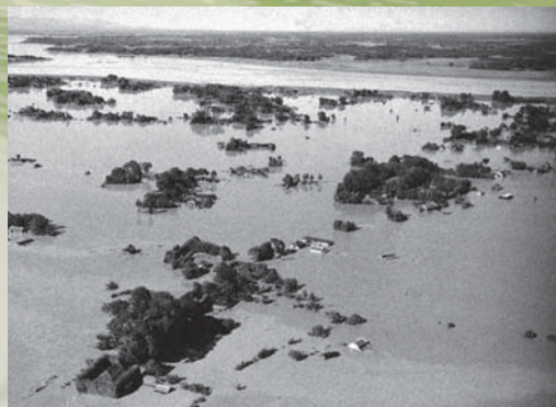
幸手町(現幸手市)付近 浸水状況