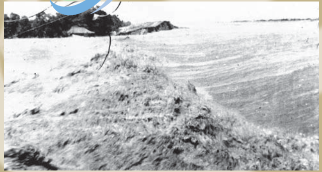
利根川決壊口からの濁流