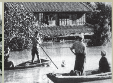
古谷村(現川越市) 浸水状況

1947年(昭和22年)9月のカスリーン台風により、利根川や荒川等の各所で堤防が決壊し、東京都区部まで広範囲にわたる浸水となり、関東地方は未曾有の被害をうけました。