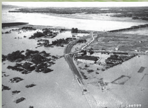
東村(現加須市)付近 浸水状況