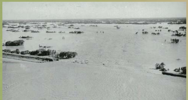
東村(現加須市)付近 利根川の決壊状況