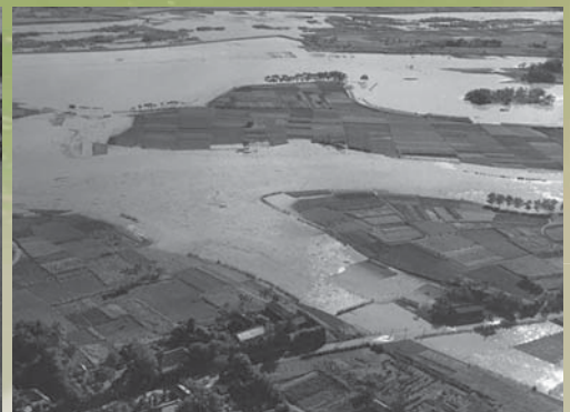
埼玉県東部地方 浸水状況