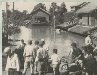
栗橋町(現久喜市) 浸水状況