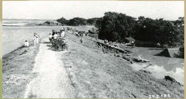
土手から決壊口を眺める人々