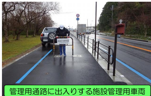
管理用通路に出入りする施設管理用車両