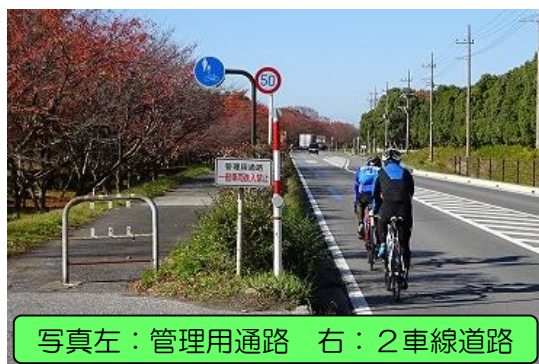
写真左：管理用通路 右：2車線道路

日々の施設点検・維持管理時にも 施設管理用車両 や 工事用車両 が 出入り し、 走行・駐車 することがあります。また、施設管理用車両等の通行の妨げとならないよう、一般車の進入や駐車を防止するために 車止め や チェーン を設置しています。