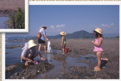
長浜市湖北町 平成6年8月(上3枚とも)