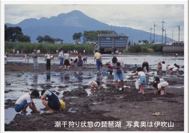
潮干狩り状態の琵琶湖 写真奥は伊吹山