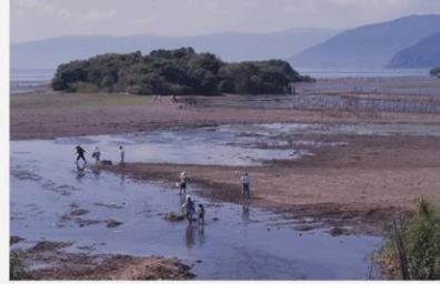
沖合いまで陸地化