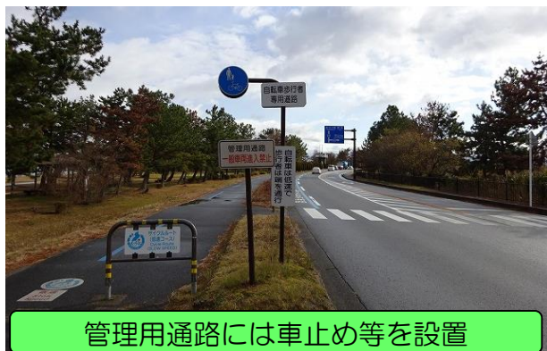
管理用通路には車止め等を設置

ビワイチで走行される際は、これらをご理解いただくとともに、歩行者に配慮して徐行する、必要に応じて自転車を降りて押すなど、 安全に十分注意しながらサイクリングをお楽しみください。