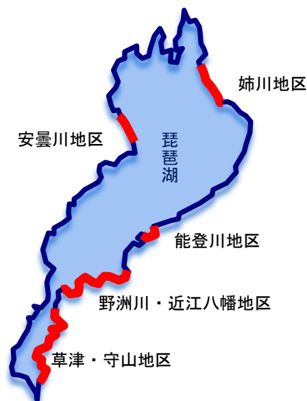
琵琶湖周辺の湖岸堤・管理用道路

ビワイチで走行される際は、これらをご理解いただくとともに、歩行者に配慮して徐行する、必要に応じて自転車を降りて押すなど、 安全に十分注意しながらサイクリングをお楽しみください。