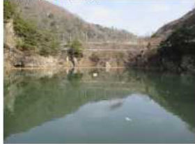
一庫大路次川上流部