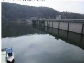
ダムサイト付近の状況