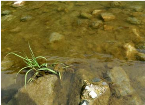
フラッシュ放流前(古い藻の付着)