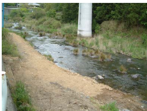
③平成 14 年に土砂を供給した直後