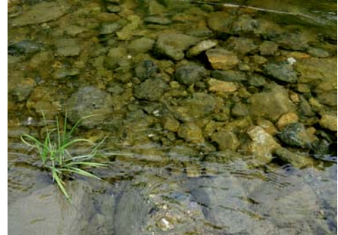
フラッシュ放流後(古い藻の剥離)