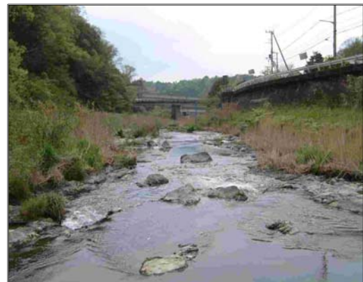
②平成 14 年の河床が露出した状況