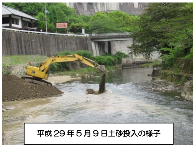
平成29年5月9日土砂投入の様子

土砂還元フラッシュ放流は、ダム直下流に土砂を直接投入し、放流量を増やして流下させ、河川に土砂を還元させます。これにより石などに付着した長く伸びた藻類をはがして、新たな藻類の成長を促進するとともに、土砂供給による底生動物や魚類等の生息環境を作り出すために行います。