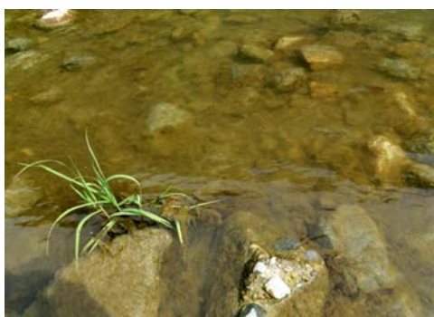
フラッシュ放流前(古い藻の付着)