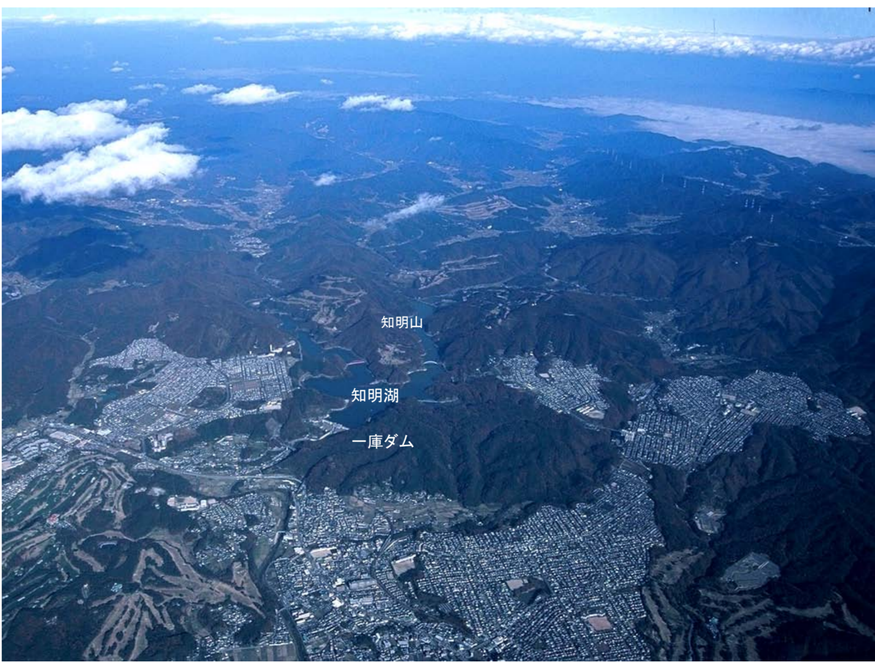
一庫ダム航空写真(1万フィート=3000m上空から)

洪水を防ぎ、流域60万人の大切な水がためである知明湖は猪名川渓谷県立自然公園に含まれ、人々が自然と触れ合える憩いの場として、散歩、ジョギング、釣り、キャンプ等で年間約30万人(近畿地方ダム第3位：H15年)に利用されています。