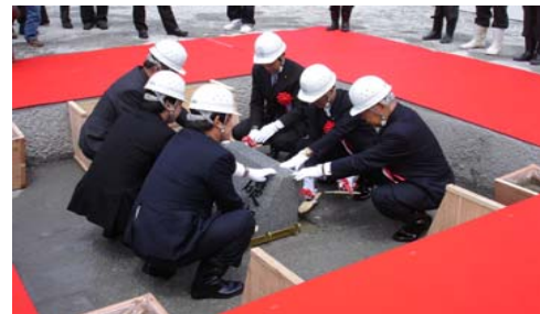
②齋饅(いみごて)の儀