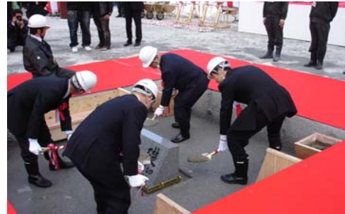
①鎮定(ちんてい)の儀