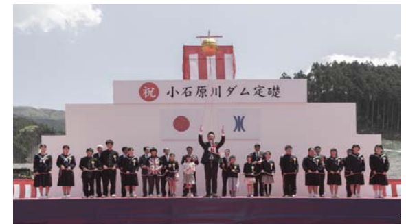
万歳三唱・くす玉開披