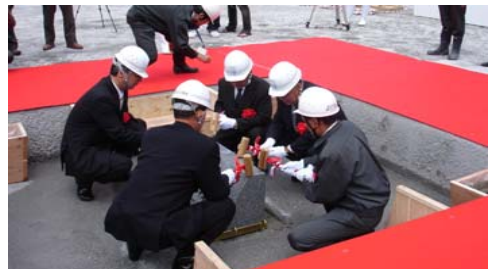
③齋槌(いみつち)の儀

搬入された礎石を固めるため、モルタルを礎石の基礎に置くもの。工事を進める道をつけるという意味がある。