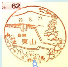
東山郵便局限定の 布目ダム風景印