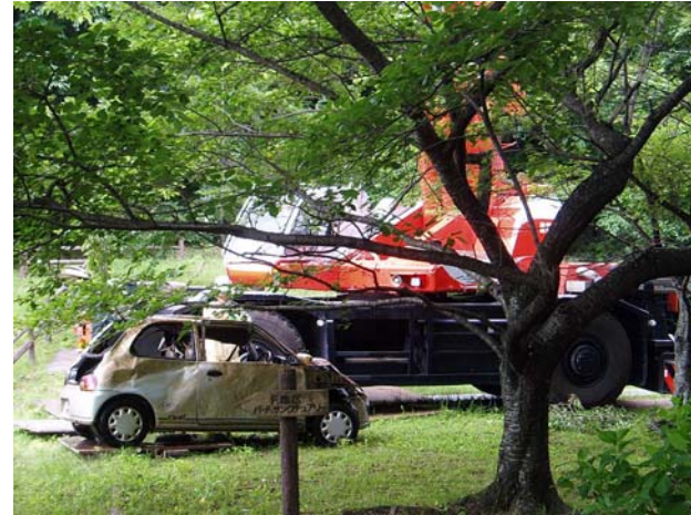
引き上げ車両写真