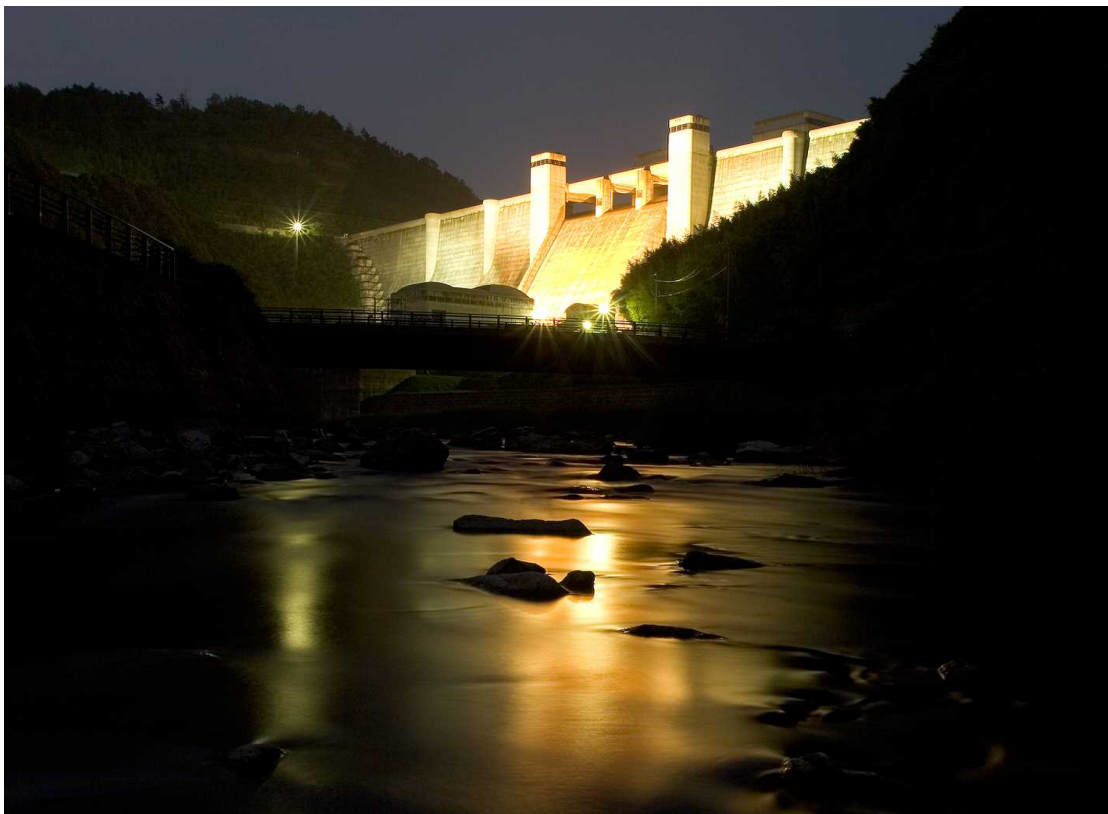
ダム下流の親水公園から望む