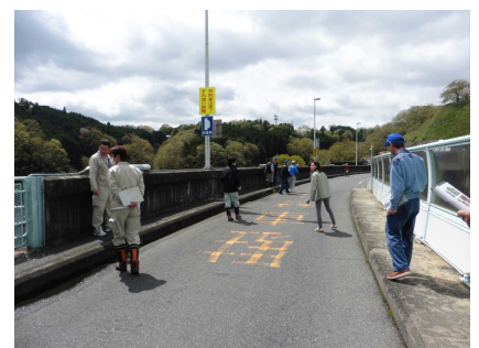
(参考) 昨年の点検実施状況