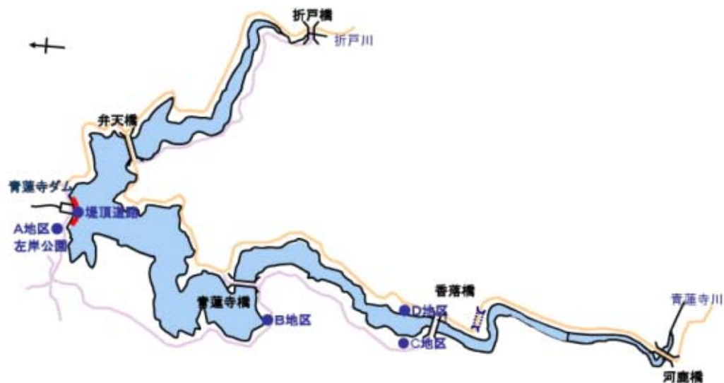
青蓮寺ダム貯水池平面図