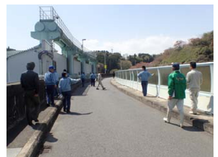
(参考)昨年の点検実施状況