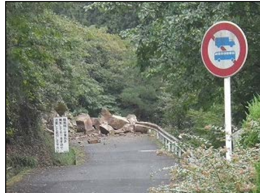
【室生ダム右岸側市道の落石箇所状況】