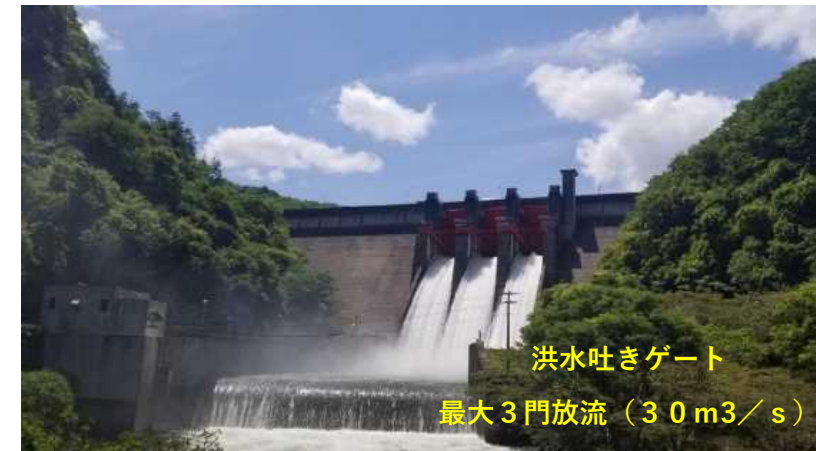
参考:ゲート放流予定時間

※ 降雨による出水等のため、事前の連絡なく中止することがありますので、ご承知お願います。