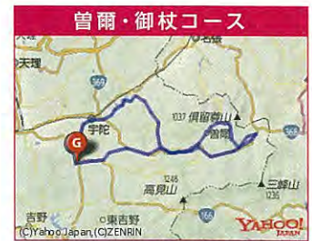
宇陀から御杖村、スキの群生で有名な曾爾村 そして室生地区をまわる曾爾・御杖コース。