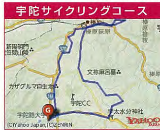
宇陀の魅力溢れる施設・景色を楽しみながら まわるサイクリングコース。

＜受付場所＞ ふれあい交流ドーム入り口付近 ＜受付時間＞ 11月23日 13:00～15:00(全コース) 11月24日 5:00～6:30(山添/曾爾・御杖コース) 8:00～9:00(宇陀サイクリングコース) ＜スタート＞ 山添/曾爾・御杖コース : 7:00～ 宇陀サイクリングコース : 9:30～ ＜ゴール＞ 全てのコース : 15:30