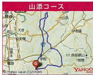
宇陀から室生そしてUCI国際レース「TOJ奈良ステージ」 のコースであった山添村・布目ダムをまわる山添コース。

※全クラス高校生年齢以下は保護者の同意書、 中学生年齢以下は保護者の同意書及び同伴を必要とします。 ※全ての参加者にはゼッケンナンバーを付けていただきます。 カテゴリーごとに色を分けコースの分岐点に配置されている立哨員が、 ゼッケンの色でコースの誘導をします。各エイドステーションで補給食 などを受け取る際にゼッケンナンバーを確認致します。