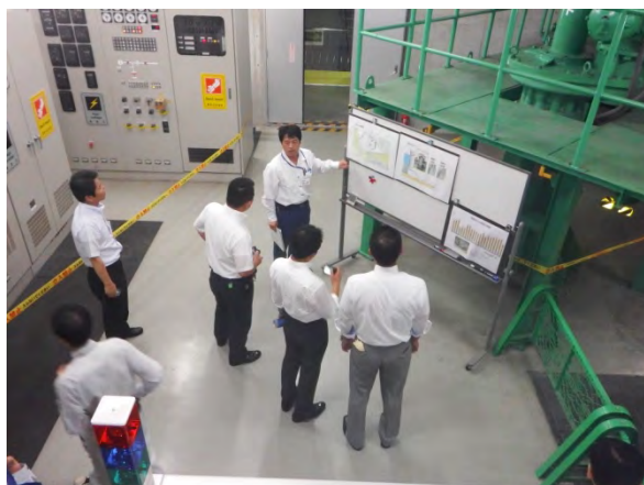
管理用水力発電設備等の説明