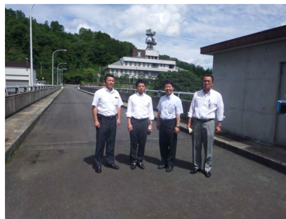
ダム堤頂にて撮影