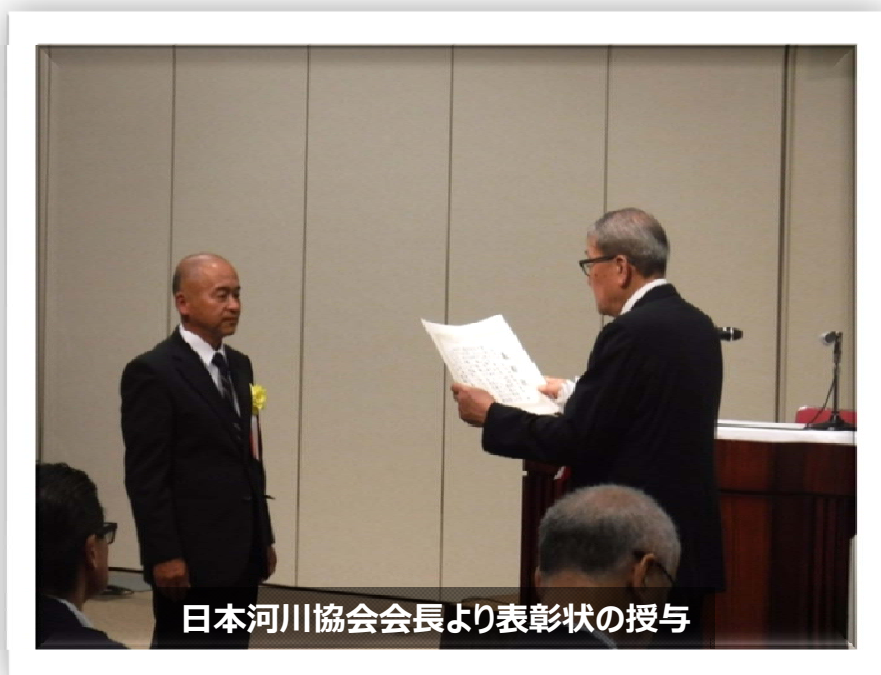
日本河川協会会長より表彰状の授与

この度、これらの継続した活動により、流域内の河川愛護や合意形成、地域の活性化に貢献している団体として、公益社団法人 日本河川協会の「令和元年河川功労者表彰」を受賞され、令和元年5月31日に、その表彰式が行われました。