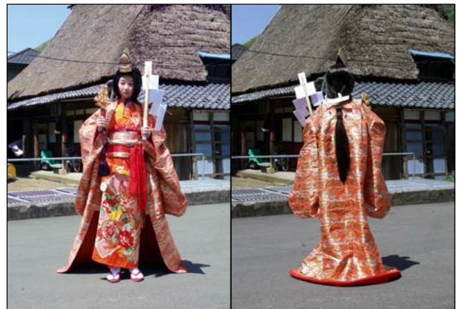
装束：着物、かずら、金冠、御幣、鈴、打掛け