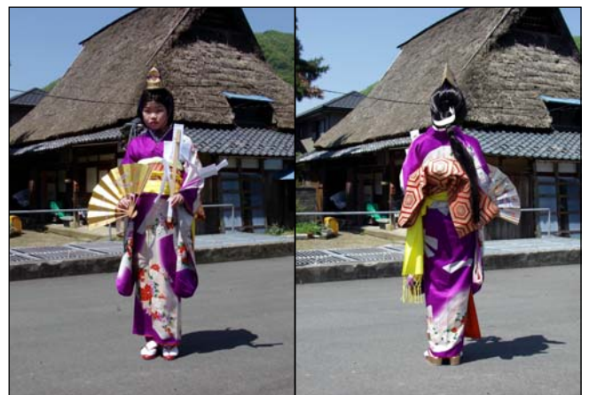
装束：着物、かずら、金冠、御幣、扇