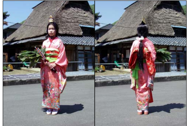
装束：着物、かずら、金冠、棒、笹