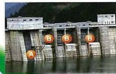
▲貯水池側から見た 選択取水塔(A)と 非常用洪水吐き(B)