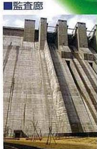
▲C 堤体下右岸にある 監査廊の入り口