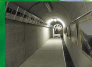
▲C 堤体内部の通路は、 写真パネルが展示さ れています。