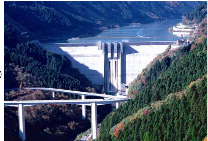
独立行政法人水資源機構 荒川ダム総合管理所