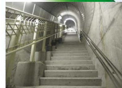
▲C 堤体内部へ通じる階段