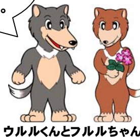
ウルルくんとフルルちゃん