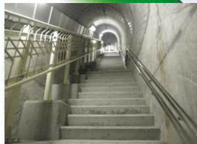
▲C 堤体内部へ通じる階段