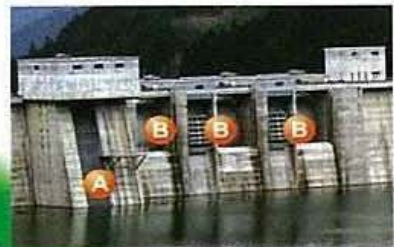
▲貯水池側から見た 選択取水塔(A)と 非常用洪水吐き(B)