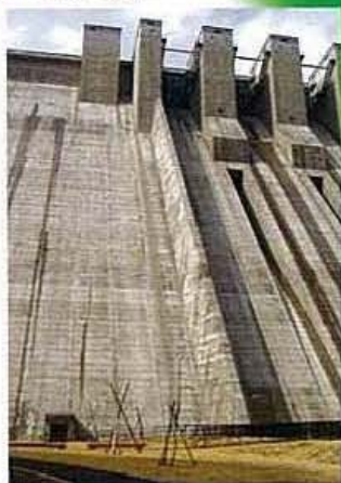
▲C 堤体下右岸にある 監査廊の入り口