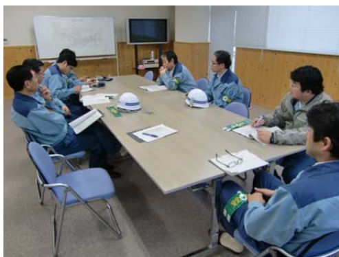
図-1 点検結果検討状況

滝沢ダム・浦山ダムでは、4月21日にゴールデンウィークを前に、安全に施設をご利用いただけるよう安全点検を実施しましたのでお知らせいたします。