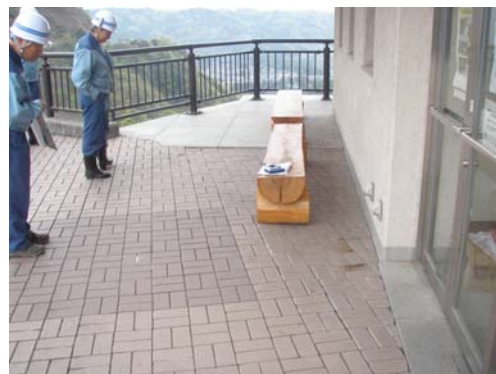
図-2 現地点検実施状況