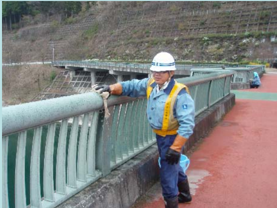
鳥のフンやクモの巣を拭き取っています。