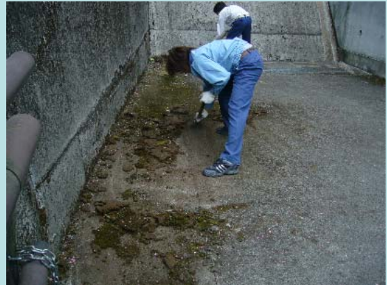
コケや枯れ草や泥を取り除いています。