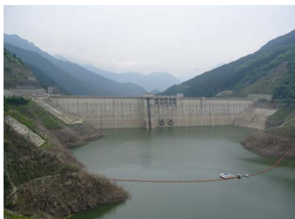
滝沢ダムの写真 (平成21年6月上旬)