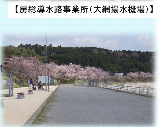
【満開の桜と30億m3通水記念事業にて整備したベンチ(長柄ダム)】