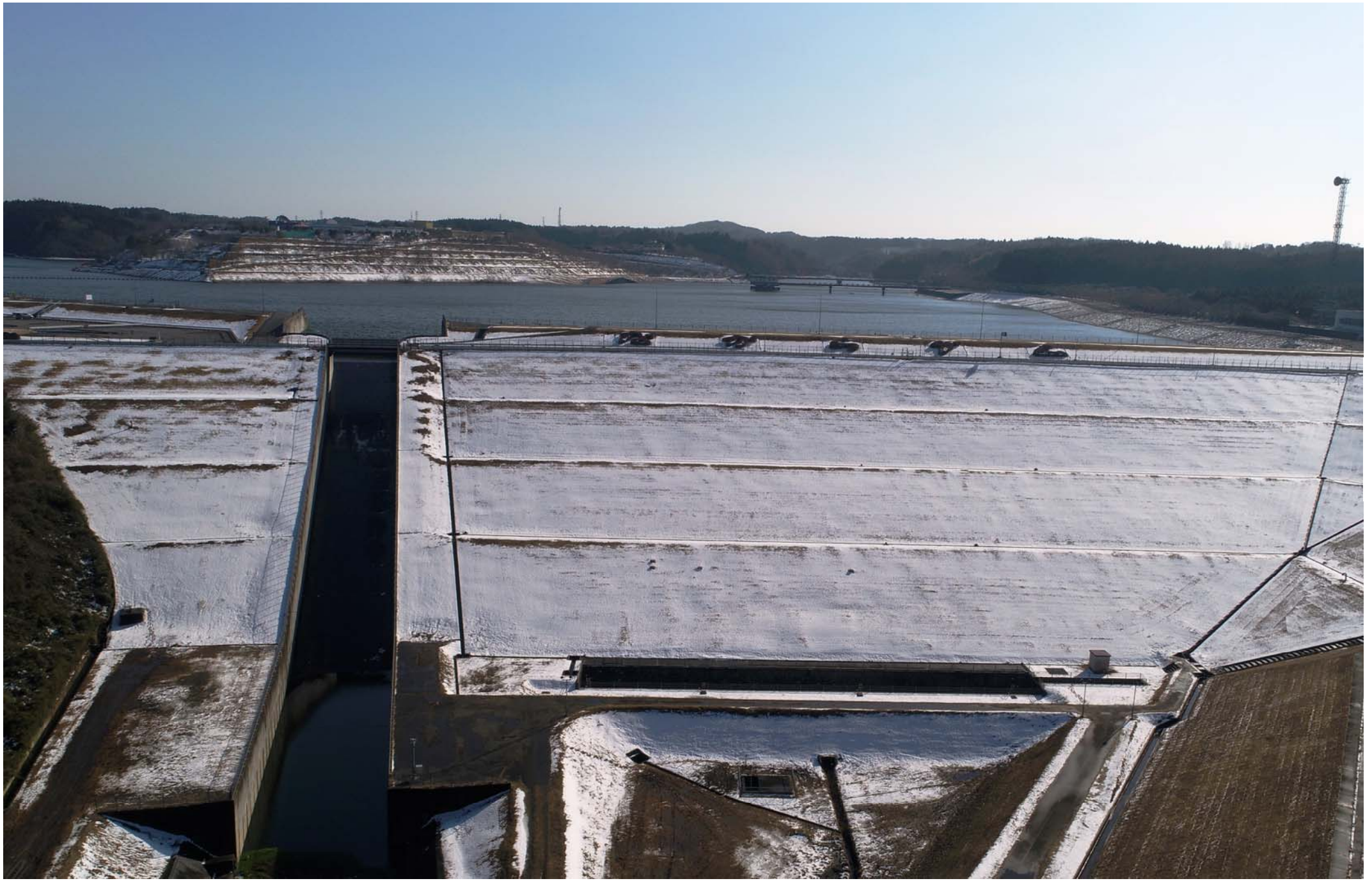
【冠雪の長柄ダム(市津湖)】