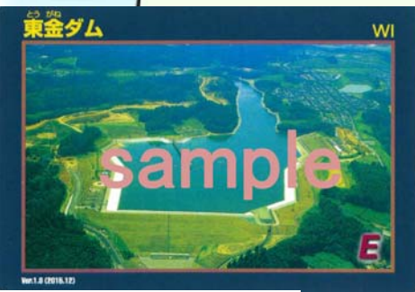
【東金ダム ダムカード】