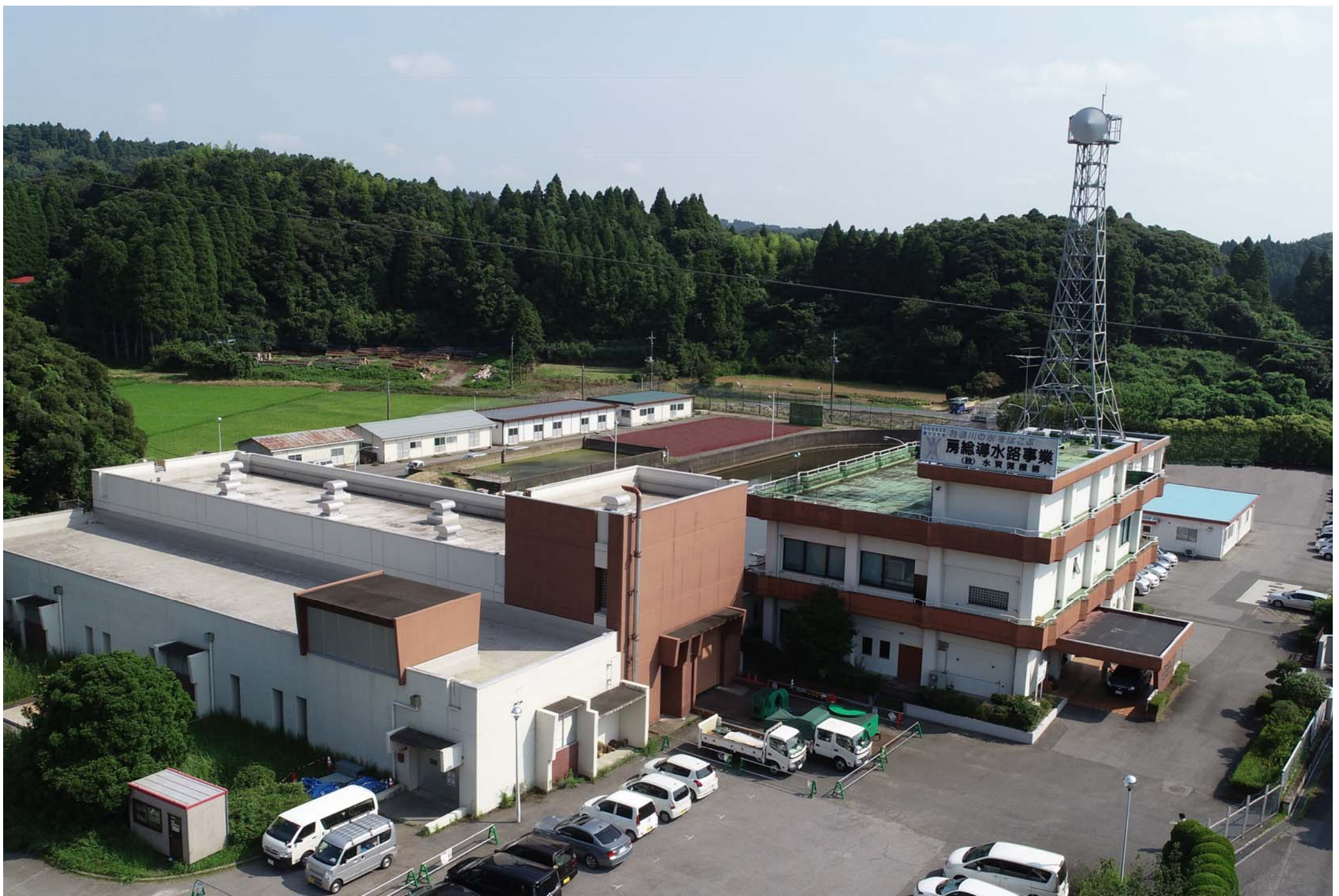
【房総導水路事業所(大網揚水機場)】