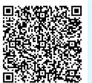
【房総ホームページ】

〒299-3245 千葉県大網白里市池田455 管理 TEL 0475-72-4121 FAX 0475-72-4119 緊急改築 TEL 0475-73-6504 FAX 0475-73-6505 Home Page: http://www.water.go.jp/kanto/bouso/