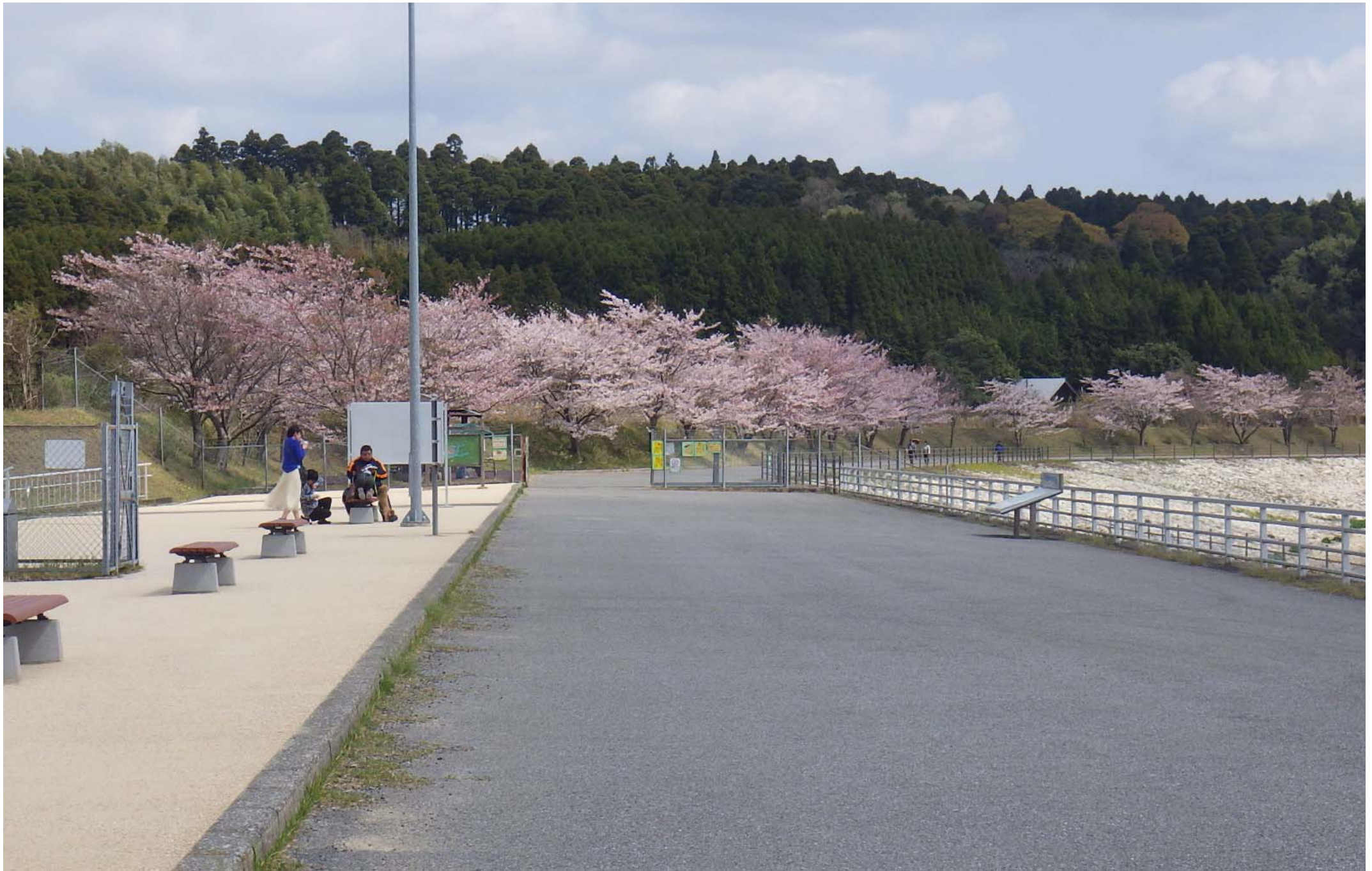
【満開の桜と30億m 3 通水記念事業にて整備したベンチ(長柄ダム)】