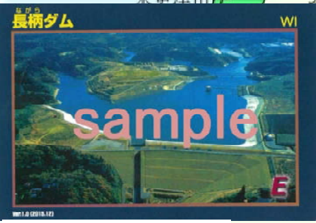
【長柄ダム ダムカード】