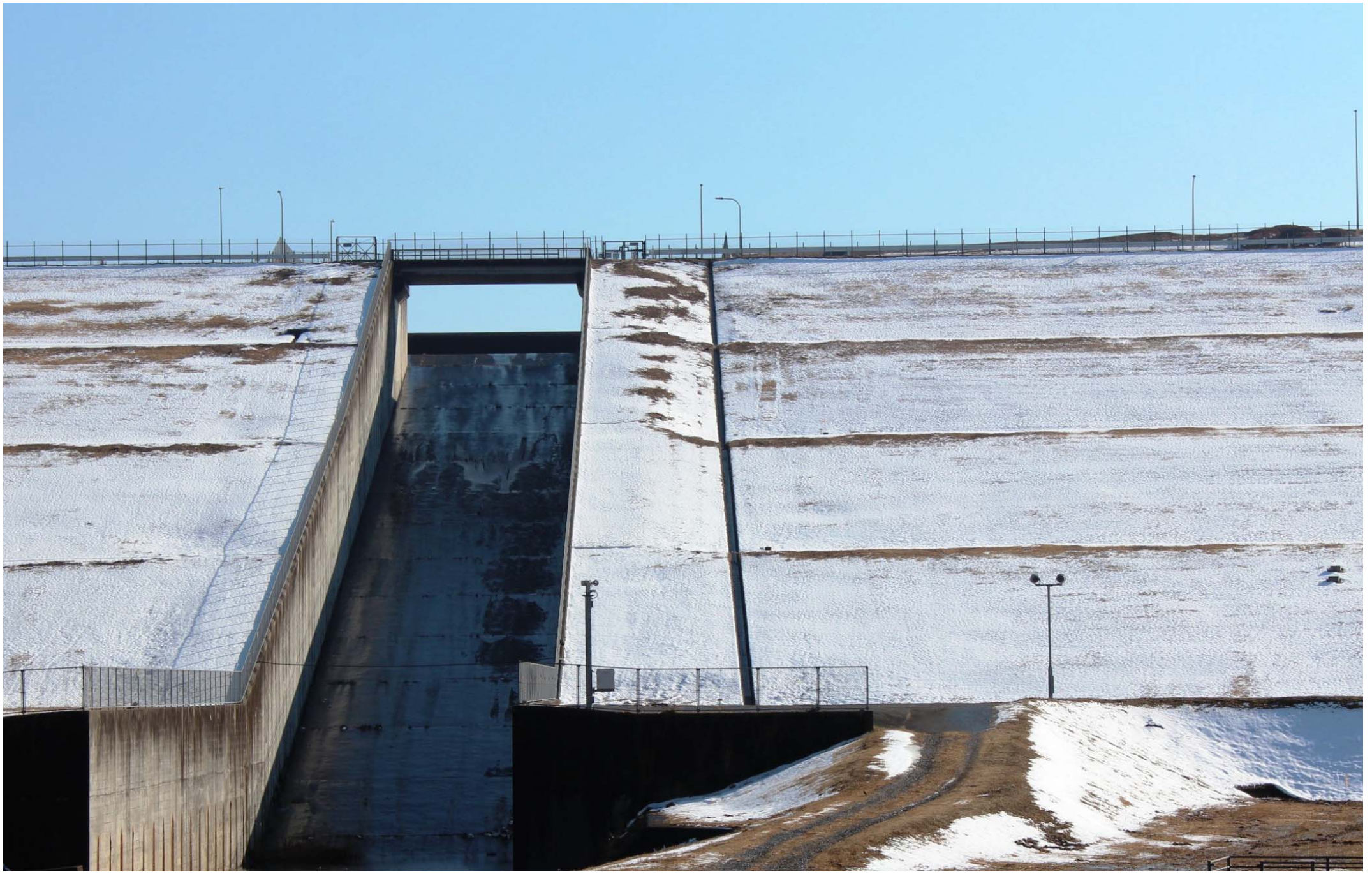
【雪化粧の長柄ダム】