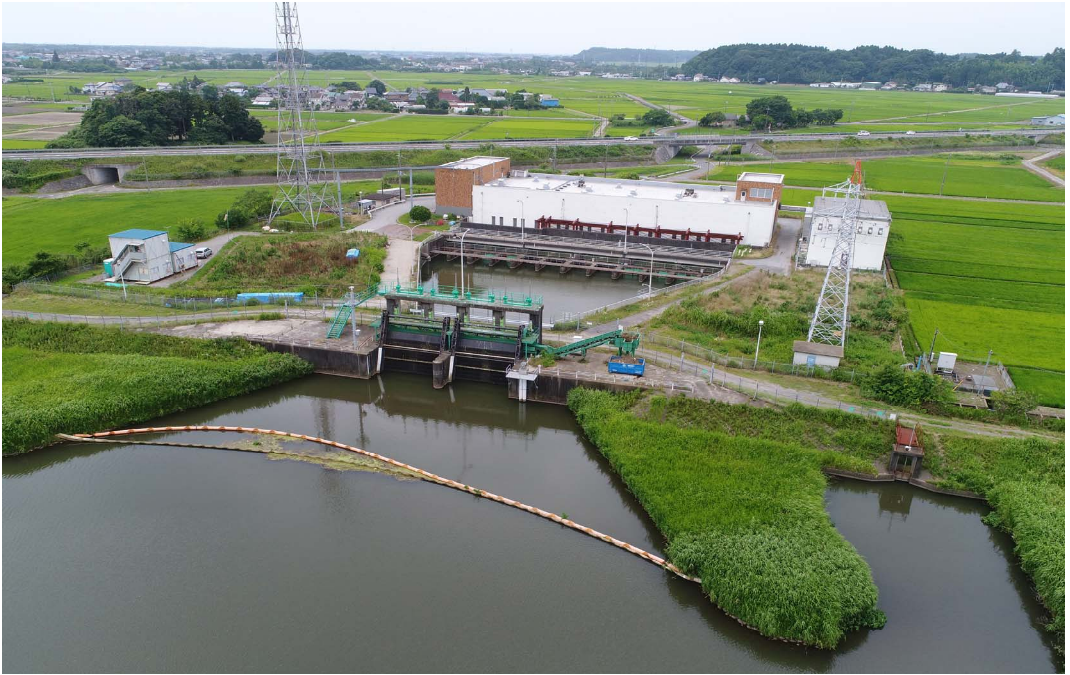
【緑に映える横芝揚水機場】