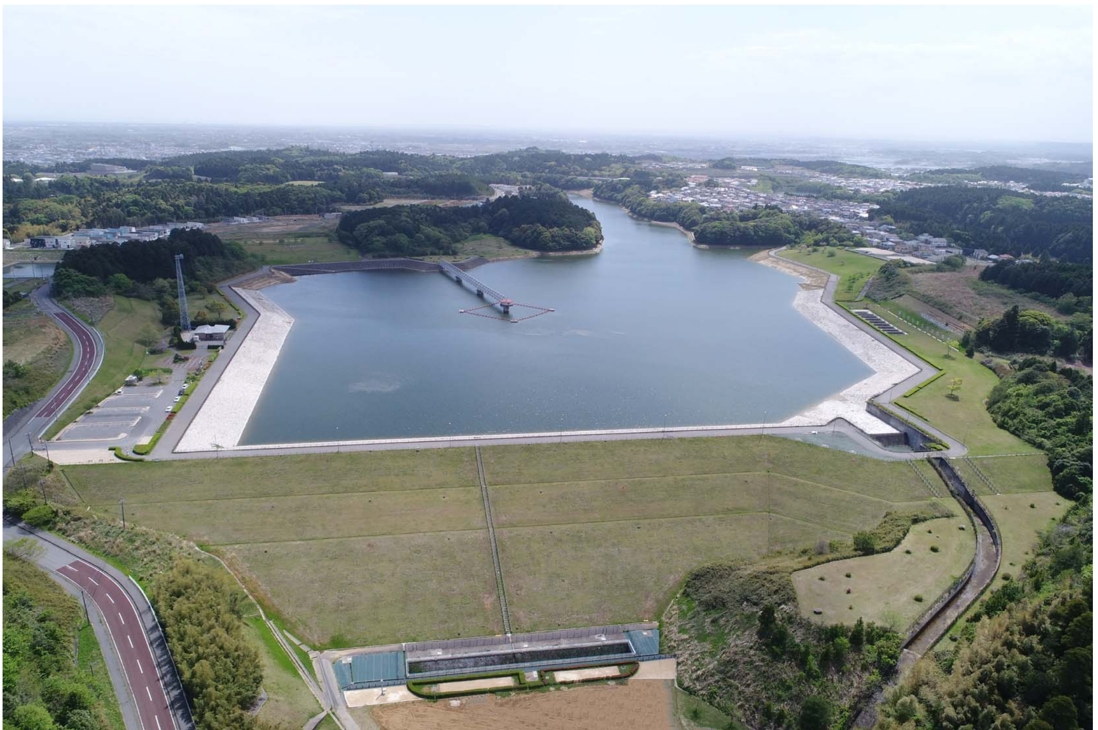
【盛夏の東金ダム(ときがね湖)】