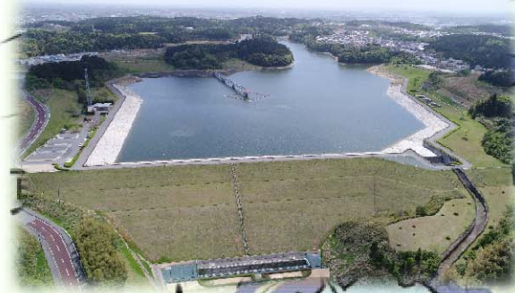
【盛夏の東金ダム(ときがね湖)】