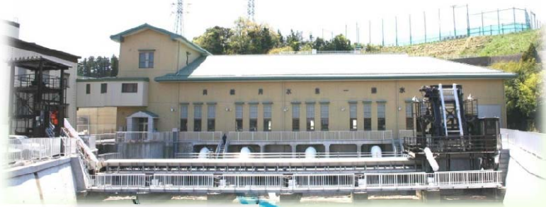
【両総用水第一揚水機場】