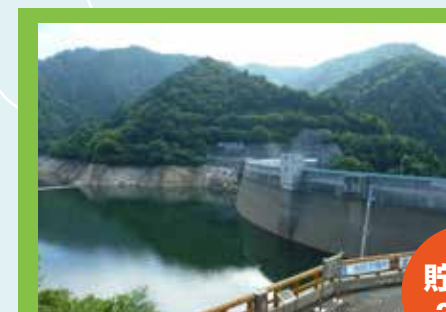
2016年8月1日の矢木沢ダム