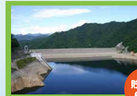
2016年8月1日の奈良侯ダム