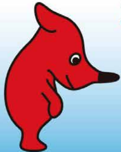
千葉県マスコットキャラクター チーバくん