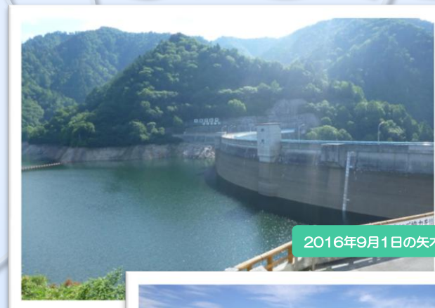
2016年9月1日の矢木沢ダム