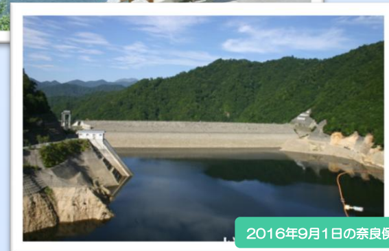
2016年9月1日の奈良俣ダム