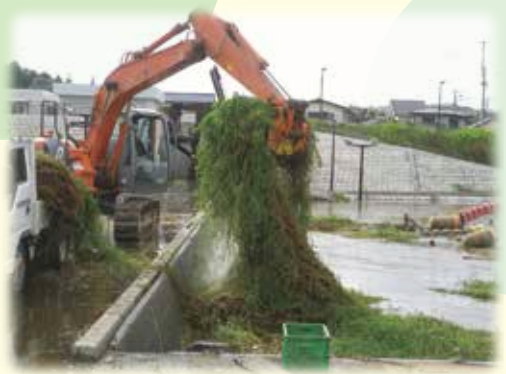
大和田機場に押し寄せた「ナガエツルノゲイトウ」の重機による除去作業風景