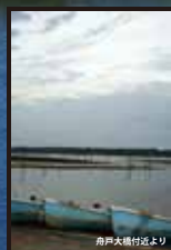
角戸大橋付近より