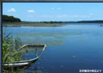
北印旛沼の周辺より