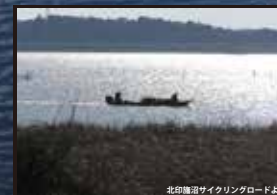
北印旛沼サイクリングロードより