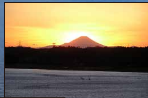
ダイヤモンド富士 瀬戸付近より