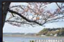
ふるさと広場桜並木より