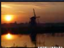
名瀬戸橋より風車を見る