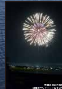
佐倉市 琵琶の火舎 印旛沼サンセットビルスより