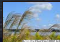
新印旛沼サイクリングロードより