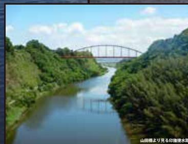
山田橋より見る印旛湖水路