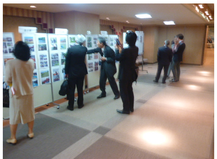
表彰者の紹介展示