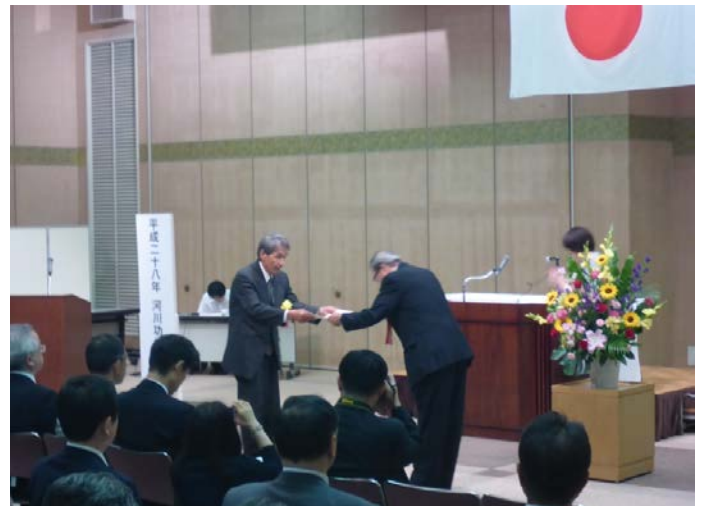
ときがねウォッチング受賞の様子