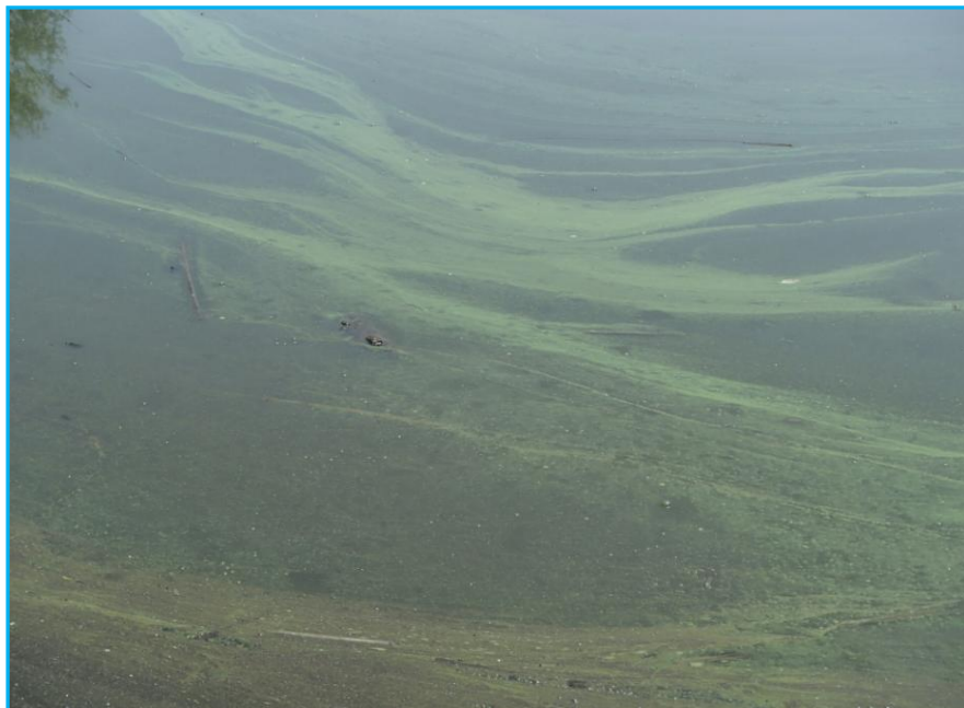
7才発生状況 写真No. 4