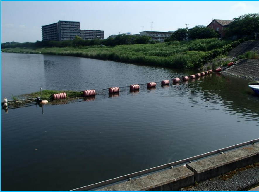
7才発生状況 写真No. 1