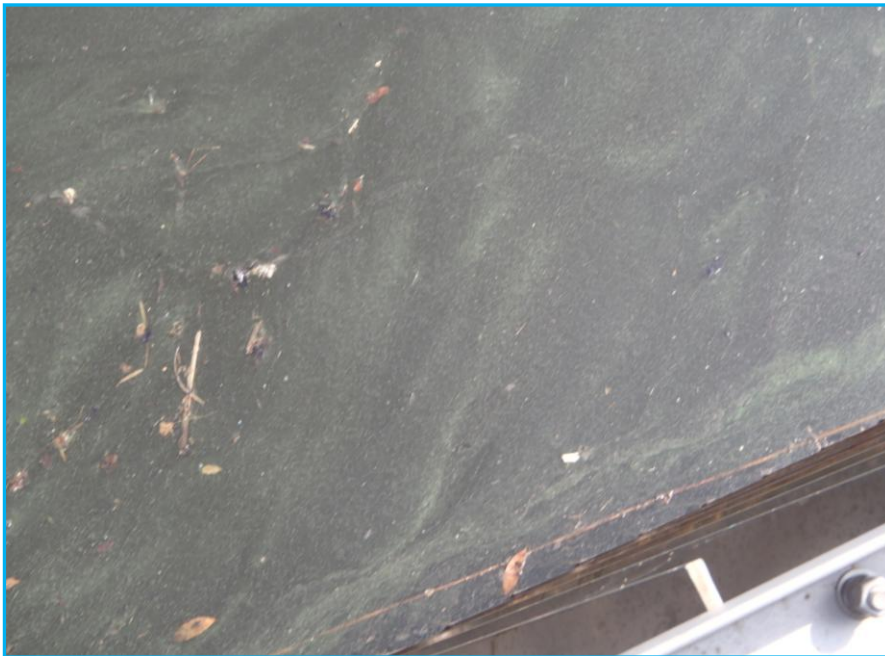
7才発生状況 写真No. 2