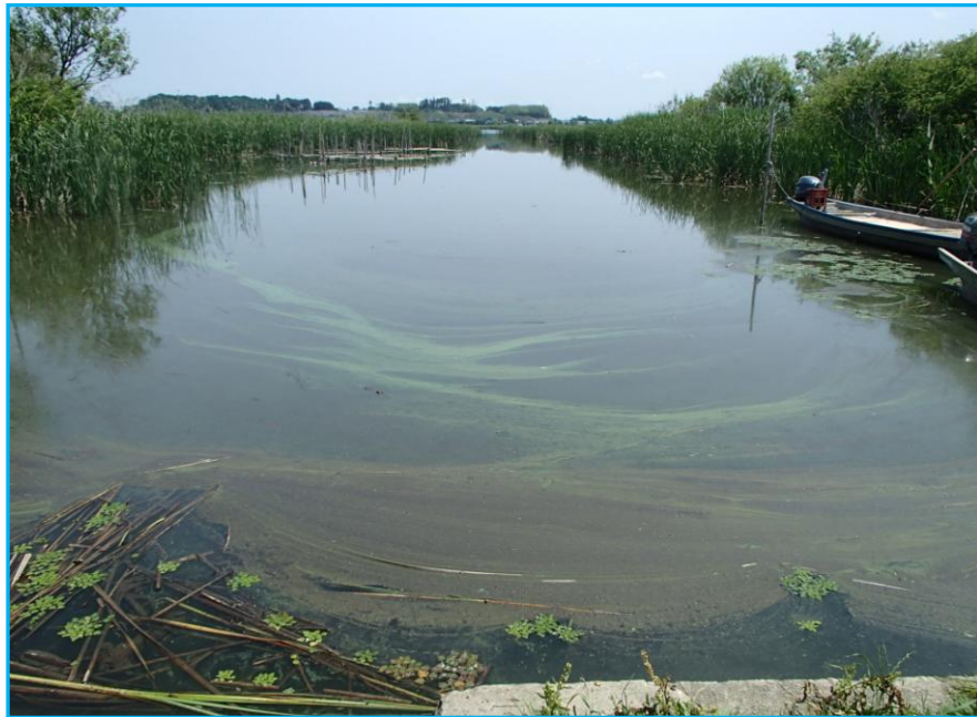
7才発生状況 写真No. 3