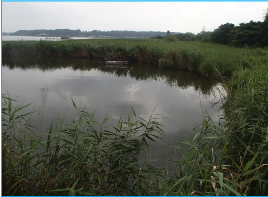
7才発生状況 写真No. 1