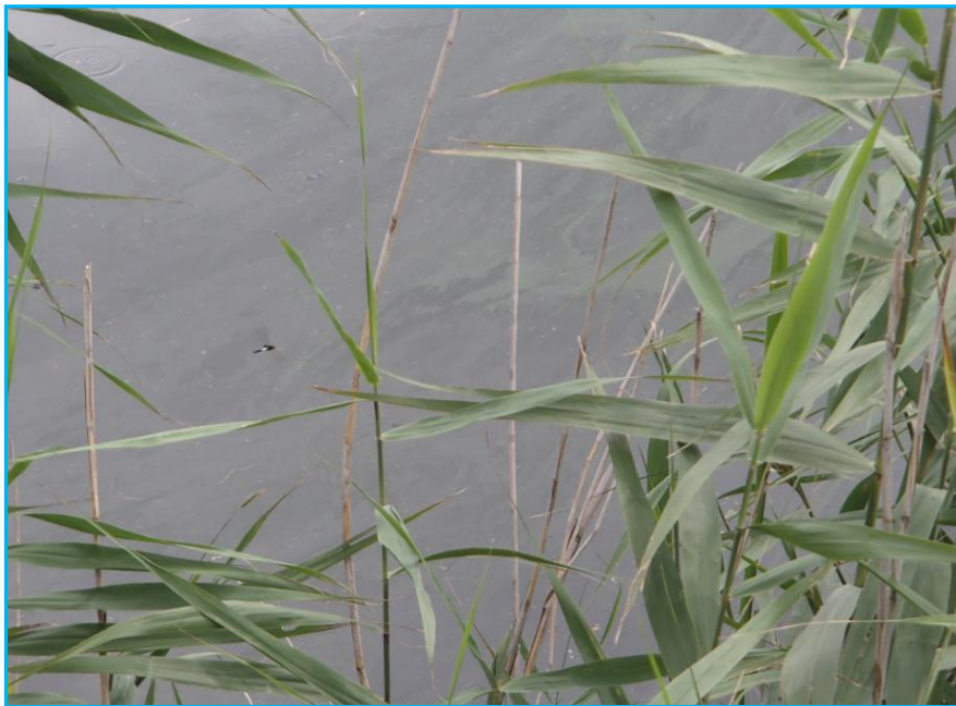
7才発生状況 写真No. 2