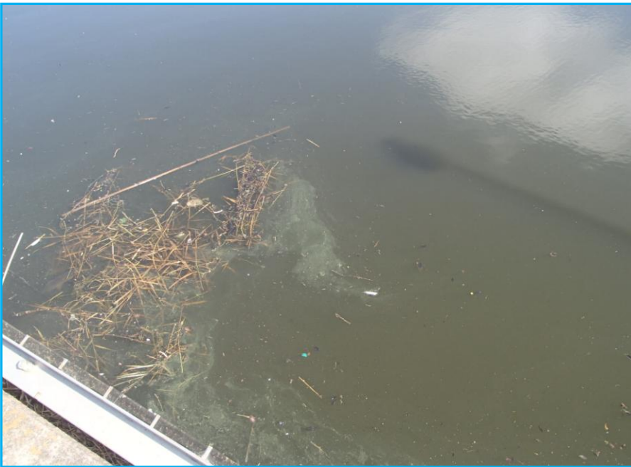
7才発生状況 写真No. 2