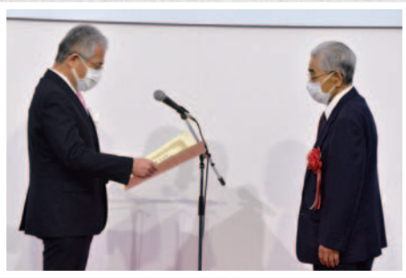
感謝状の贈呈 (小石原川ダム水没者対策協議会会長へ)