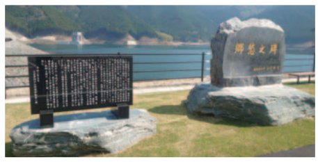
ダム湖畔にある郷愁之碑