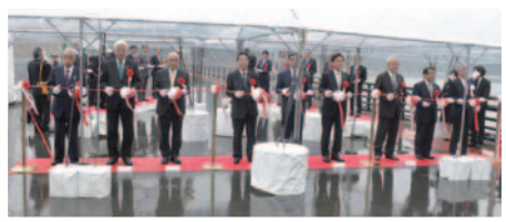
出席者によるテープカット