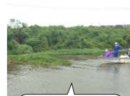
船で群落を牽引する様子