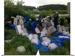
陸上への引き上げ作業もひと苦労！

また、水土里ネット印旛沼(印旛沼土地改良区)主催による「外来植物ナガエツルノゲイトウ防除作業」にも参加しました(10月3日佐倉市臼井田干拓「通称：かっぱ公園」にて)。ここでの防除作業は、今回で4回目になります。地域住民、市民団体、民間企業、行政機関等から、約170名もの皆さんが参加され、防除に汗を流しました。