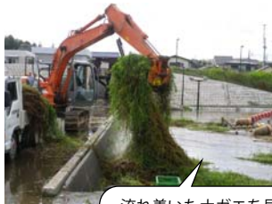
流れ着いたナガエを昼夜問わず除塵しました