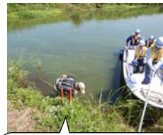
切れ枝が流出しないよう監視