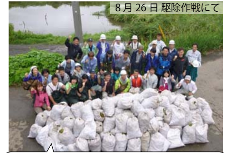
8月26日 駆除作戦にて

(開催日：7月27日、8月26日、9月23日、11月2日、11月27日(千葉用水は欠席)の計5回)