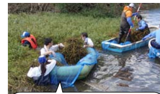
刈り取った群落をボートで運ぶ様子

また、水土里ネット印旛沼(印旛沼土地改良区)主催による「外来植物ナガエツルノゲイトウ防除作業」にも参加しました(10月3日佐倉市臼井田干拓「通称：かっぱ公園」にて)。ここでの防除作業は、今回で4回目になります。地域住民、市民団体、民間企業、行政機関等から、約170名もの皆さんが参加され、防除に汗を流しました。