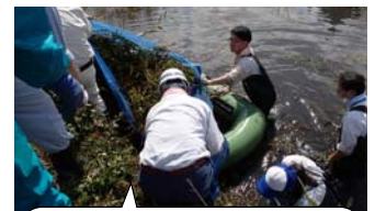
陸上への引き上げ作業もひと苦労！

これらの取り組みは、多くの皆様のご協力が必要です。皆さまのご参加をお待ちしております。