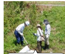
根を掘り起こし徹底除去