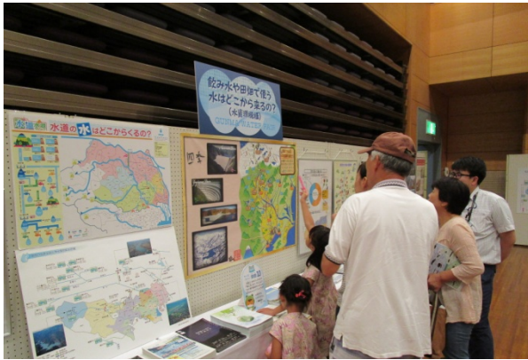
ダムの場所はどこかな?

群馬県において、私たちの毎日の生活や産業活動等を支えている水の貴重さ、水力発電所やダム等の水資源施設の果たす役割について皆さんに理解を深めて頂くために、「ぐんまウォーターフェア」が今年も7月28日から30日まで、ぐんまこどもの国児童会館にて開催され、当機構も参加しました。