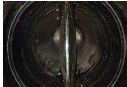
2-3 蝶形弁の弁体状況 止水する装置です。