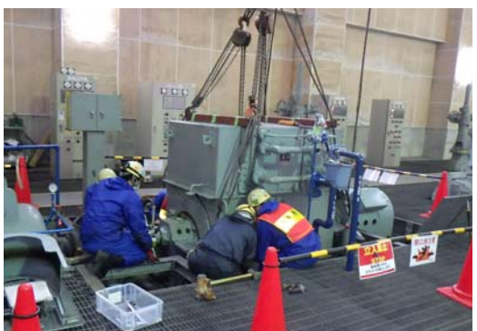
1-3 モーターの据付状況 モーターを据付けております。