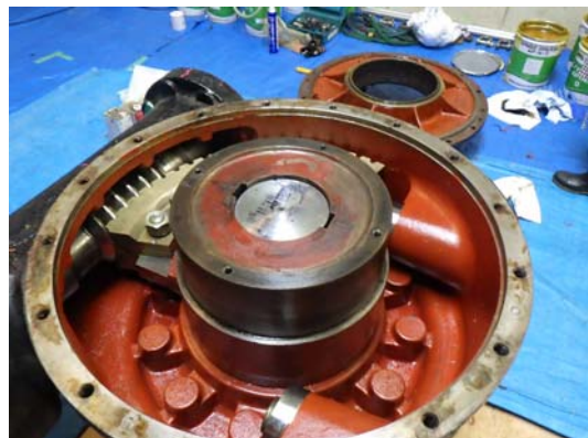
2-1 減速機の内部状況 歯車により弁を動かす装置です。