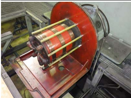
1-2 モーターの分解状況 ポンプを動かす装置です。