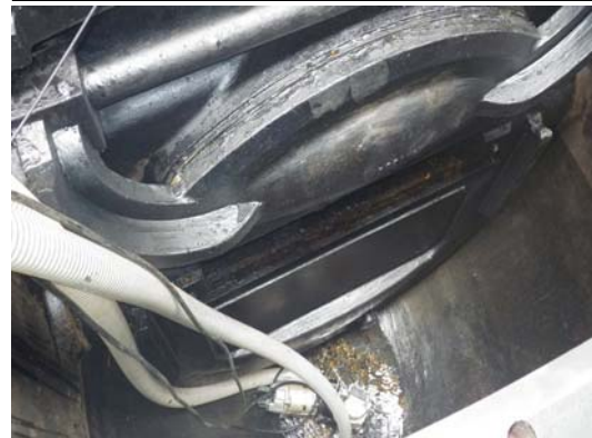
2-2 逆止弁の弁体状況 水の逆流を防ぐ装置です。