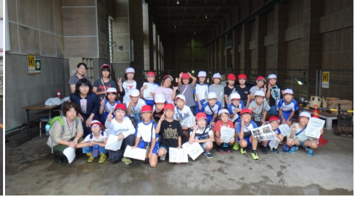
霞ヶ浦南小学校 4年1組のみなさん