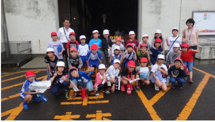
霞ヶ浦南小学校 4年2組のみなさん