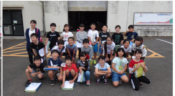
霞ヶ浦北小学校 4年1組のみなさん