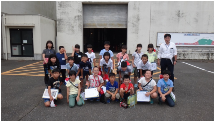
霞ヶ浦北小学校 4年2組のみなさん