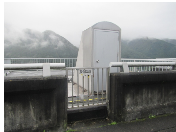
2号ピア資材搬入口