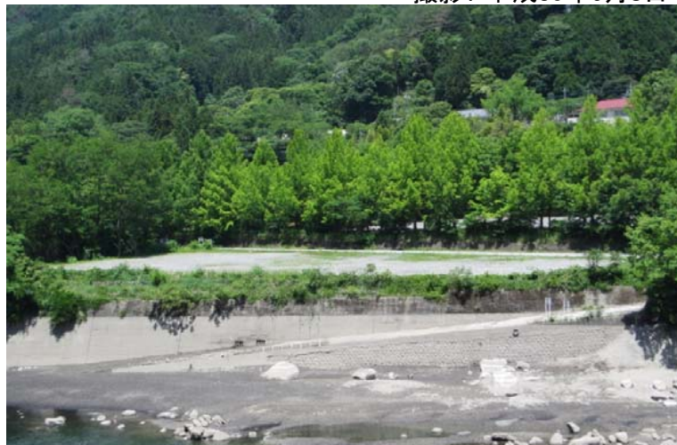
写真1. 売り渡し対象物仮置き場の状況写真(左岸より撮影)