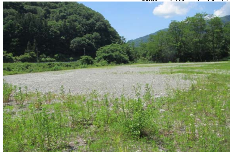
写真2. 売り渡し対象物仮置き場の状況写真(仮置き場の上流側より撮影)