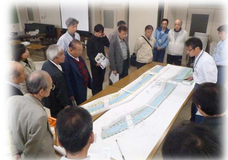
赤見台近隣公園周辺の整備について熱心に意見交換を行う参加者の皆様(鴻巣市箕田公民館にて)

次回、第四回ワークショップでは、これまで以上に頂戴した意見等を踏まえた最終の計画案を提案させていただきます。整備イメージの確認及び意見交換を行う予定です。開催日時等については、後日、回覧等によりお知らせさせていただきます。皆様の声ワークショップでお聴かせ下さい。