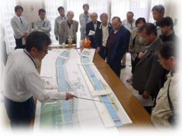
赤見台近隣公園周辺の整備について意見交換を行う参加者(鴻巣市赤見台地区)

三回目となった今回のワークショップにおいても、参加頂いた皆様からは期待の声や落胆の声など、その他様々な声を頂戴しています。ワークショップも大詰めを迎え、今後、関係機関等の協力のもと、より良い整備の実現に向けて、検討を進めていきたいと考えています。