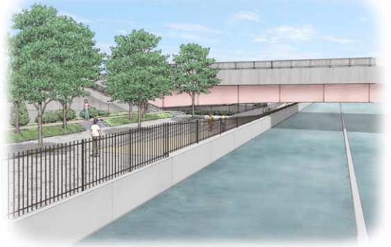
機構案のイメージ