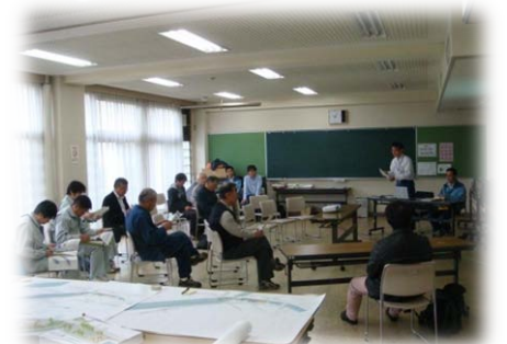
箕田公園周辺の整備について熱心に意見交換を行う参加者の皆様(鴻巣市箕田公民館にて)