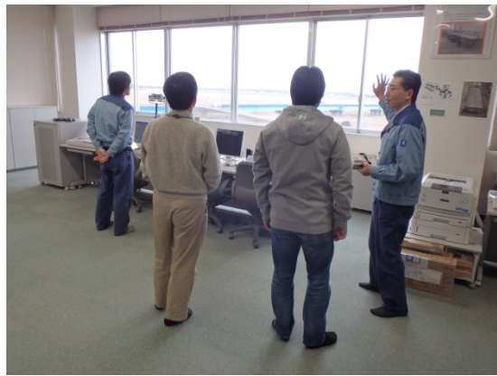
操作室での説明状況