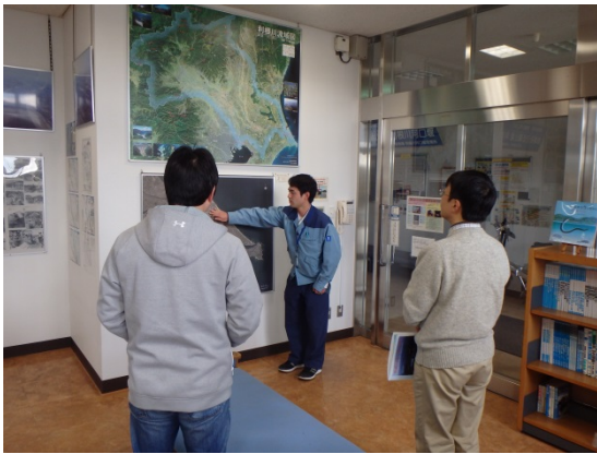
展示ホールでの説明状況

その後、心配していた風も穏やかだったので、予定通り水上巡視体験を行いました。今回の見学会は、河口堰のゲートやコンクリート部分の工事を行う時期と重なったため、維持管理の様子を間近で眺めていただくことができました。また、河口堰周辺を船で移動している間には、水面近くを泳ぐ魚や大空を飛び回る野鳥など利根川下流部の情景を味わって頂きました。