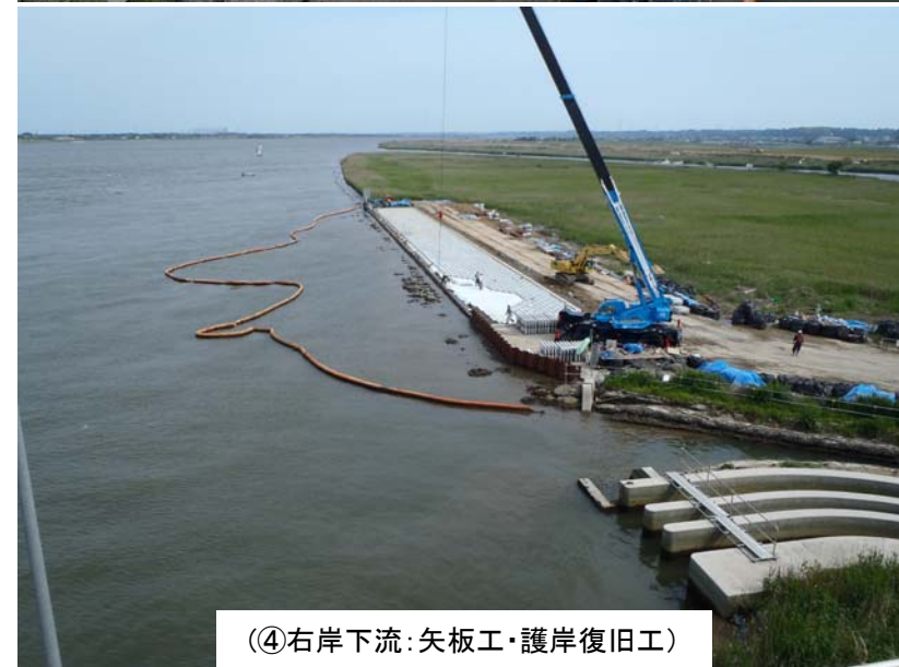
④右岸下流: 矢板工・護岸復旧工