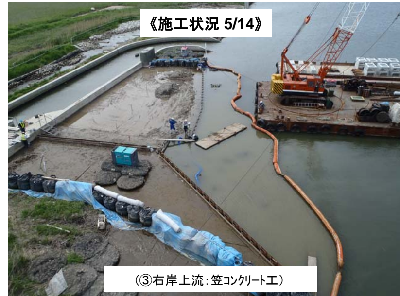
《施工状況 5/14》 ③右岸上流: 笠コンクリート工