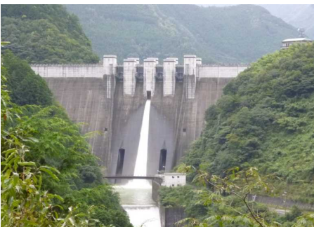
常用洪水吐き（オリフィスゲート） 放流イメージ（毎秒約6m 3 ）

http://www.water.go.jp/yoshino/ikeda/event.htm