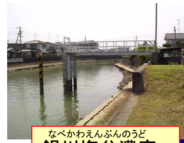
なべかわえんぶんのうど 鍋川塩分濃度 観測所