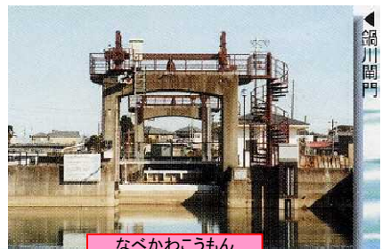
なべかわこうもん 鍋川閘門