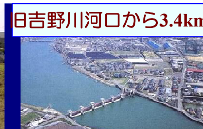
旧吉野川河口から3.4km