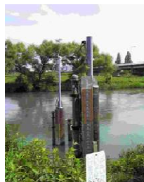
おおてらばしすい 大寺橋水位 観測所