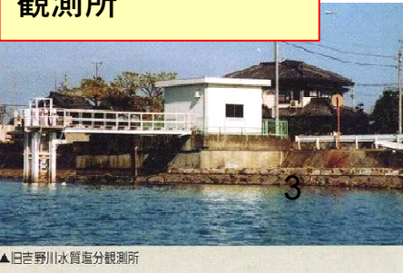
▲旧吉野川水質塩分観測所