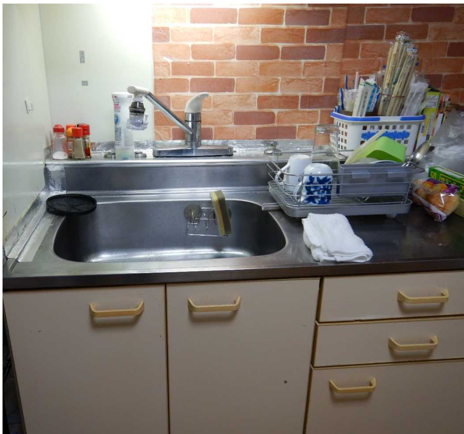
埋田宿舎13号 現況写真