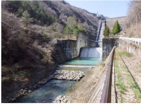
【笹川橋地点】 濁度 0.8度