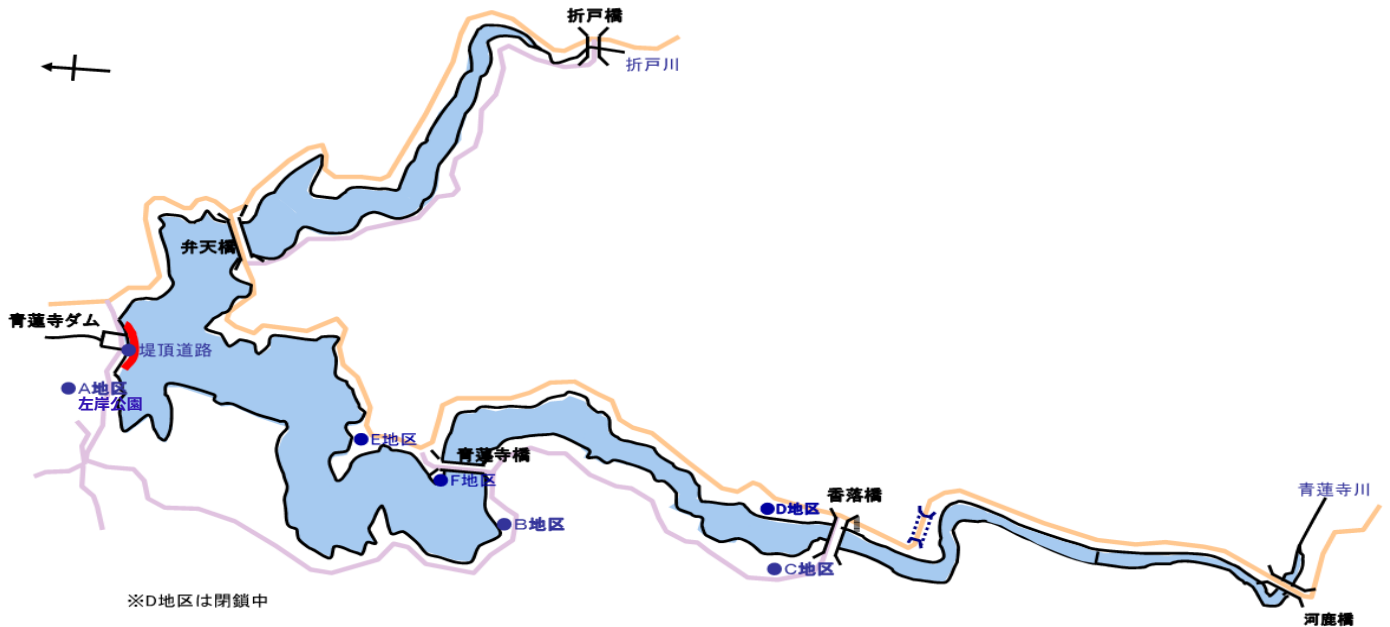
青蓮寺ダム貯水池平面図