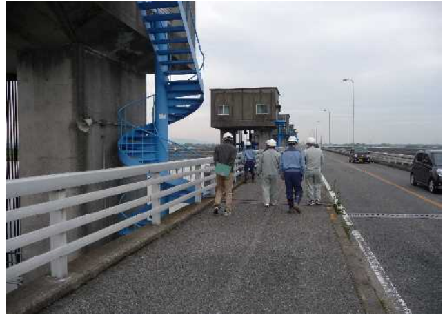
管理橋の確認状況