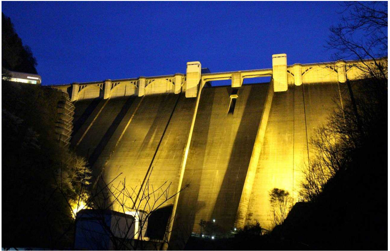
昨年のライトアップ（令和5年3月31日撮影）