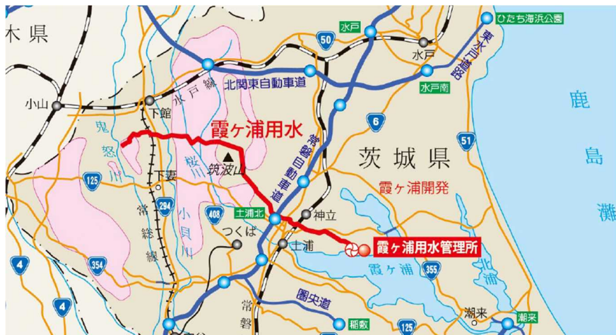
霞ヶ浦用水管理所 位置図

ミズヒマワリとは…中央・南アメリカ原産の特定外来生物。日本各地の河川や水路に侵入しており、通水被害や水中の貧酸素化を引き起こすことが知られている。